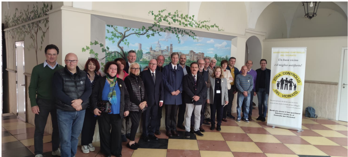
ASSEMBLEA ACDV NAZIONALE A MANTOVA